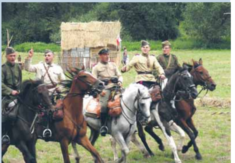
Przejazd ze śpiewem dla publiczności kawalerii ochotniczej 1920 roku – Ossów 15 VIII 2012 rok.