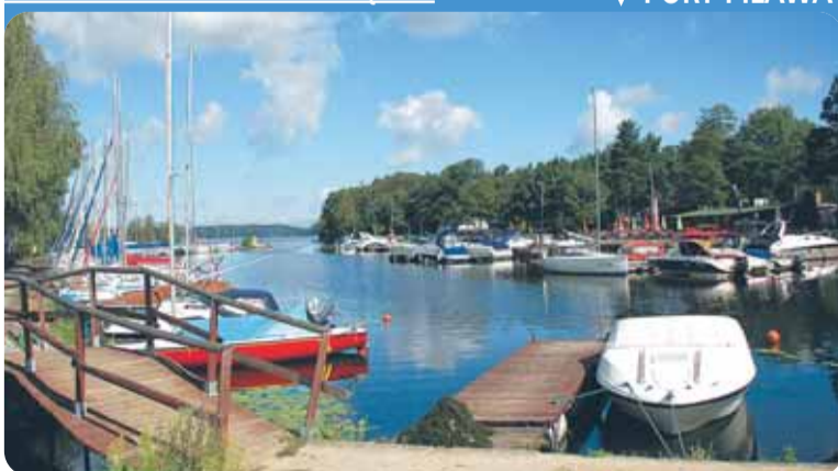
▼ PORT PILAWA

Dzikiej Plaży, ale także wyzwoлиło możliwości prywatnych inwestorów.