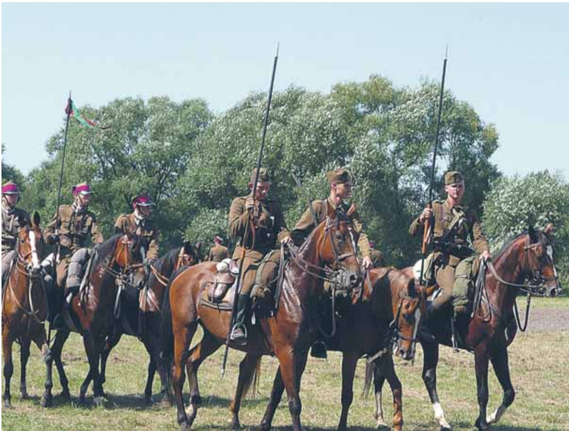
Parada kawalerii Mistrzostwa Polski Formacji Kawaleryjskich – Ossów 15 VIII 2009 rok